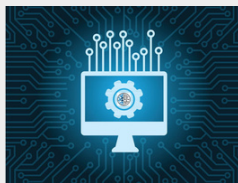
Il National Cancer Institute ha assegnato un contratto per lo sviluppo di uno strumento di reclutamento di sperimentazioni cliniche basato sull'intelligenza artificiale basato sull'oncologia